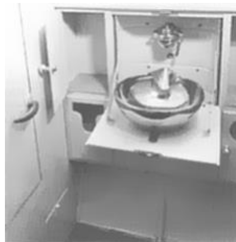
Der Waschraum im Heck der zivilen He 111.