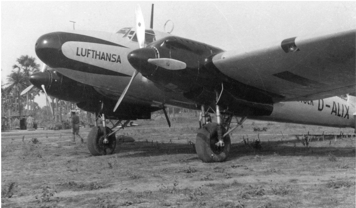
Die V-2, als erste für den Zivileinsatz gebaute He 111, trug den Namen „Rostock“ und flog bis zu ihrem Absturz 1937 im Postdienst nach Afrika.