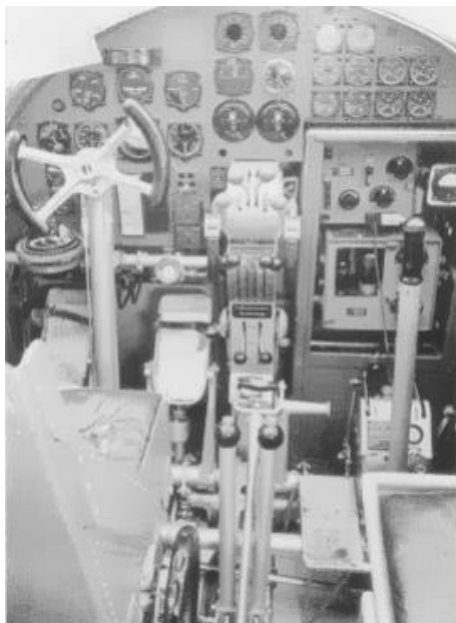
Führersitz der He 111 C. Im Durchgang zum Platz des Bombenschützen befanden sich Funkgeräte, die aber entfernt werden konnten.